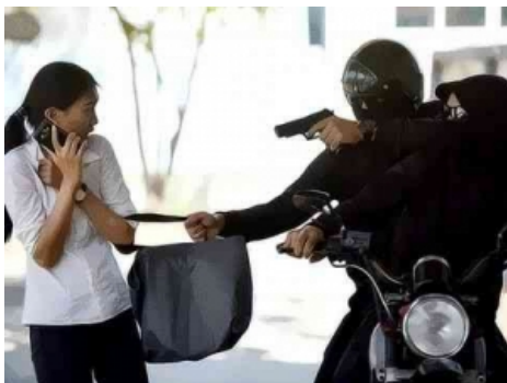
Gambar 2. Perilaku Kriminal

Perilaku kriminal adalah setiap tindakan atau kelalaian yang melanggar hukum pidana dan dapat dikenai sanksi oleh negara. Dari sudut pandang psikologi forensik, perilaku kriminal tidak hanya dilihat sebagai pelanggaran terhadap norma hukum, tetapi juga sebagai ekspresi dari dinamika psikologis individu, interaksi sosial, serta faktor lingkungan yang kompleks.