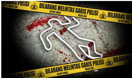
Gambar 15. Ilustrasi Tempat Kejadian Perkara (TKP)

langkah berikutnya. Seorang profiler harus berusaha memahami apa yang sebenarnya terjadi di TKP, bukan hanya dari bukti fisik, tetapi juga dari konteks sosial dan psikologis yang melingkupinya. Prinsip dasarnya adalah cara berpikir seseorang akan memandu perilakunya, sehingga dengan mempelajari perilaku pelaku di TKP, profiler dapat menelusuri pola pikir yang melatarbelakanginya.