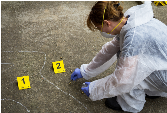
Gambar 16. Ilustrasi Crime Scene

dalam kasus pembunuhan berantai yang dilakukan oleh Ted Bundy, setiap serangan menunjukkan pola perencanaan matang, korban dipilih berdasarkan tipe tertentu, dan pelaku berusaha menyembunyikan keterlibatannya dengan cermat. Profil pelaku semacam ini sering kali menggambarkan seseorang yang perfeksionis, manipulatif, dan memiliki kebutuhan psikologis untuk mempertahankan kendali atas situasi dan korban.