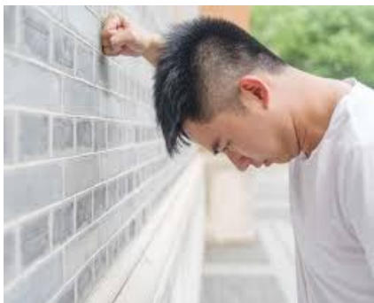
Gambar 9. Ilustrasi Mekanisme Pertahanan Represi