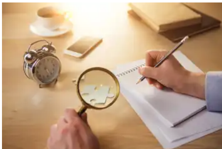
Gambar 13. Ilustrasi Observasi