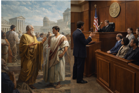
Gambar 1. Ilustrasi Peradilan

Seiring perkembangan zaman, konsep forum berubah menjadi pengadilan, yaitu sebuah wadah untuk mencari kebenaran hukum. Karena itu, segala sesuatu yang terkait dengan 'forensik' berarti berkaitan dengan proses hukum.