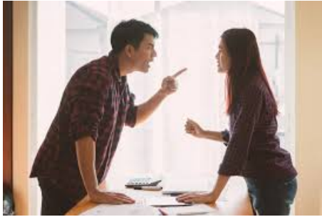
Gambar 10. Ilustrasi Mekanisme Pertahanan Acting Out