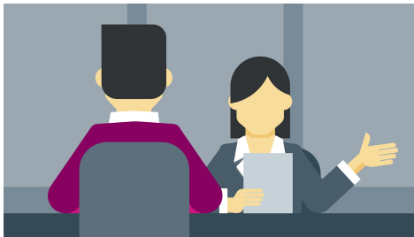
Gambar 7. Ilustrasi Wawancara