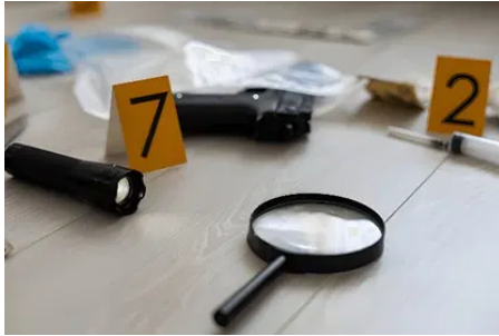
Gambar 6. Ilustrasi Investigasi