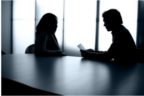
Gambar 8. Ilustrasi Wawancara Investigasi