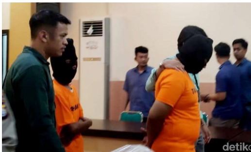
Gambar 18. Ilustrasi Motif Kejahatan Financial Gain