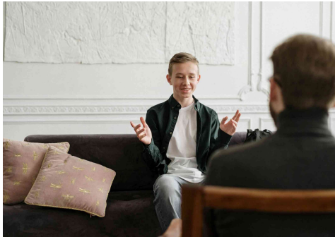
Gambar 11. Ilustrasi Mendengarkan Aktif

bicara; dan positive silence (diam yang bermakna untuk memberi ruang untuk berpikir).