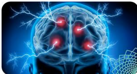
Gambar 3. Ketidakseimbangan Neurotransmitter