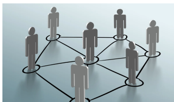
Gambar 5. Faktor Lingkungan